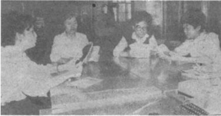
市邮电局长话班紧紧围绕提高通信质量这一主题，积极开展质量管理(QC)小组活动，被评为“全市邮电系统优质服务”竞赛先进集体。瞧，她们正认真地训练普通话。

随着生活水平的提高，“水涨船高”，小学生的小口袋也不再是空的。有了钱，花起来也就比较方便。但有的学生却偷拿家中的钱，更