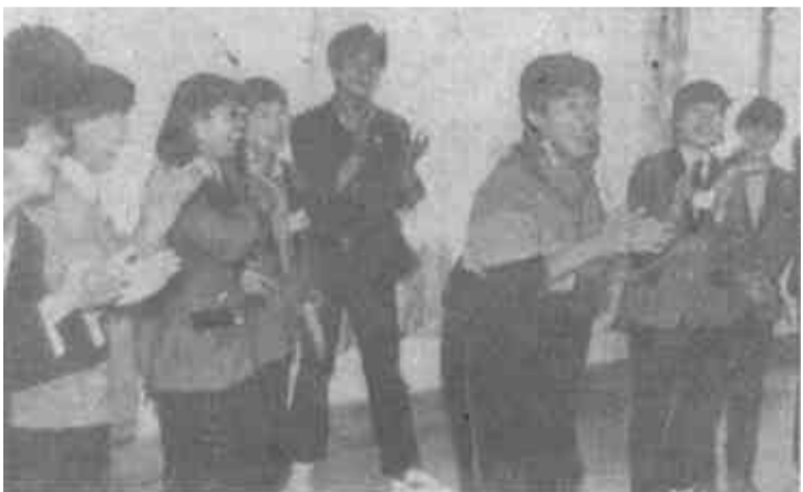
△ 黄花饭店党支部善于根据青年特点，把思想政治工作与开展健康向上的娱乐活动结合起来，寓教于乐，寓乐于教，收到良好效果。图为他们开展活动中的一个场面。